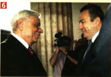
6. Υπό την αιγίδα του Πρύτανη του Πανεπιστημίου Αθηνών, καθηγητή Μελέτιου - Αθανασίου Δημόπουλου, παρουσία του Προέδρου Δημοκρατίας Προκόπη Παυλιπόπουλου και ηγήτους κόσμου, παρουσιάστηκε στη μεγάλη αίθουσα τελετών του Πανεπιστημίου Αθηνών το νέο βιβλίο του τέως βουλευτή Ροδόπης και πρώην υπουργού, δούκ. Ευρωπαϊκή Στ. Στυλιανίδη, με τίτλο «Φράξη: Το επόμενο βήμα...».