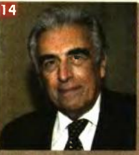
14. «Ο δικαστής, ο νόμος και το περιβάλλον» είναι το τίτλος του τριτοετούς τμήματος για τον επόμενο πρόεδρο του Συμβουλίου της Επικρατείας Κώστα Μενουδάκο (φωτό), που παρουσιάστηκε στο ακριβές πρόγραμμα του Γαλλικού Ινστιτούτου. Μίλησαν ο υπουργός Ν. Κοτζιάς, ο π. Πρόεδρος της Δημοκρατίας Π. Πικραμένος, ο καθηγητής του Πανεπιστημίου Ι. Καρακιστάς και η δικηγόρος Αν. Παπαδημητρίου-Τότσου. Η Ελληνική Εταιρεία Δικαίου του Περιβάλλοντος (ΕΕΔΠ), μετά την αποχώρηση του προέδρου του Συμβουλίου της Επικρατείας Κώστα Μενουδάκου από το δικαστικό σώμα, αποφάσισε να εκδώσει έναν τόμο για να τιμήσει το έργο του από τα πρώτα βήματά του στο Ανάκτορο Ακυρωτικό Δικαστήριο της χώρας έως την ημέρα της αποχώρησής του από την κορυφή της δικαστικής πυραμίδας. Ο κ. Μενουδάκος, σύμφωνα με συνεντεύξεις του, αλληλ και νομικούς, είναι ένας από τους πιο διάσημους δικαστές, νομικούς και επιστήμονες της χώρας μας που φώτισαν και τίμησαν τον χώρο της δικαιοσύνης.